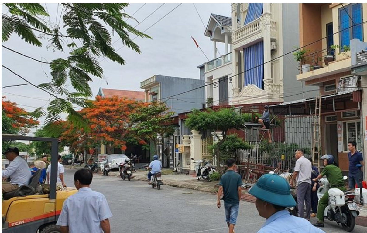
Trong quá trình giải tỏa sử dụng phương tiện cơ giới

Để lập lại trật tự hành lang ATGT, tạo hình ảnh đẹp về khu du lịch ven biển đang được đầu tư quy hoạch xây dựng theo hướng văn minh, bền vững, thân thiện và mến khách. Thực hiện chỉ đạo của Ban ATGT huyện, Ban ATGT thị trấn Quất Lâm tổ chức ra quân giải tỏa vi phạm trật tự hành lang giao thông các tuyến đường. Thời gian thực hiện thường xuyên, liên tục trong năm 2024, trong đó tập trung đợt cao điểm từ 19/5/2024 đến 29/5/2024 và từ 05/6/2024 đến 20/6/2024. Tổ chức tuyên truyền lưu động trên hệ thống phát thanh thị trấn và hệ thống loa truyền thanh tại các nhà văn hóa tổ dân phố.