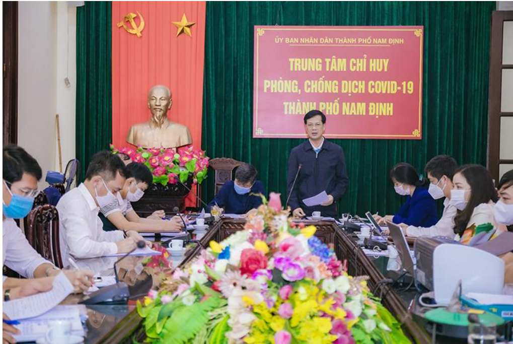
Đồng chí Nguyễn Anh Tuấn - Ủy viên BTV Tỉnh ủy, Bí thư Thành ủy, Chủ tịch HĐND thành phố phát biểu tại buổi họp

Phát biểu chỉ đạo tại cuộc họp, đồng chí Nguyễn Anh Tuấn - Ủy viên BTV Tỉnh ủy, Bí thư Thành ủy, Chủ tịch HĐND thành phố Biểu dương ngành các cấp các ngành và toàn thể các phường, xã trên địa bàn thành phố; Thành phố cũng ghi nhận những đóng góp, ủng hộ của cộng đồng Doanh nghiệp, sự tin tưởng, đồng lòng ủng hộ của các tầng lớp nhân dân trong công tác triển khai các biện pháp phòng chống dịch Covid-19 trên địa bàn thành phố trong suốt thời gian vừa qua. Nhằm phát huy tốt vai trò lãnh đạo, chỉ đạo trong công tác phòng chống dịch, đồng chí yêu cầu các Toàn thể hệ thống hệ thống chính trị, các lực lượng vào cuộc, nhất là các phường, xã và các cấp cơ sở thực hiện nghiêm các biện pháp phòng, chống dịch bệnh theo phương châm " phát hiện nhanh, khoanh vùng gọn, truy vết thần tốc, xét nghiệm sàng lọc, điều trị tích cực, không để dịch lây lan ra diện rộng ". Phân công cho các tổ Covid cộng đồng giám sát, theo dõi các trường hợp, F1, F2 đang cách ly tại nhà.